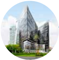
Complexe Capital Reforma Mexique