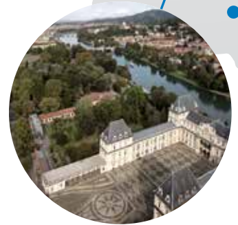
Université polytechnique de Turin Italie