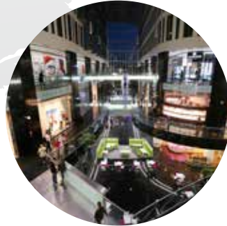
Union Square City Shopping de Varsovie Pologne