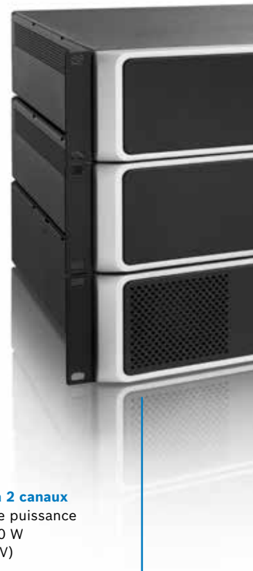
Amplificateur à 2 canaux Amplificateur de puissance classe D 2 x 500 W (Sortie 70/100 V)