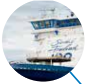
Flotte de brise-glaces Finlande