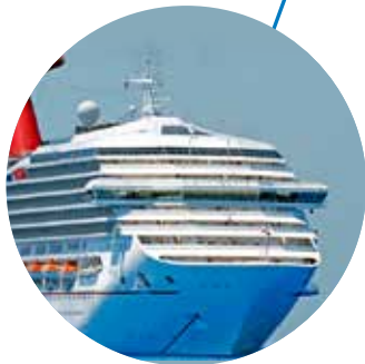
Carnival Triumph Carnival Cruise Line Floride