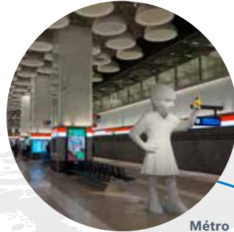
Métro d'Helsinki Finlande