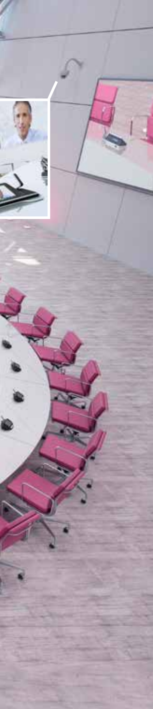
Contrôle caméra automatique