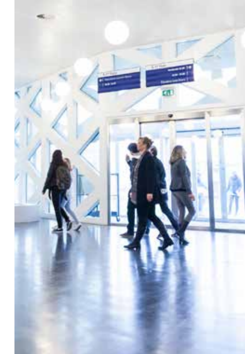
PAVIRO: comunicazione al pubblico, evacuazione vocale e qualità audio professionale