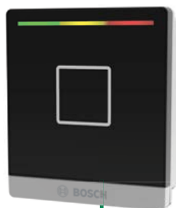
Czytniki kontroli dostępu z funkcją BLE (Bluetooth Low Energy)