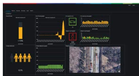
Панель управления с несколькими виджетами