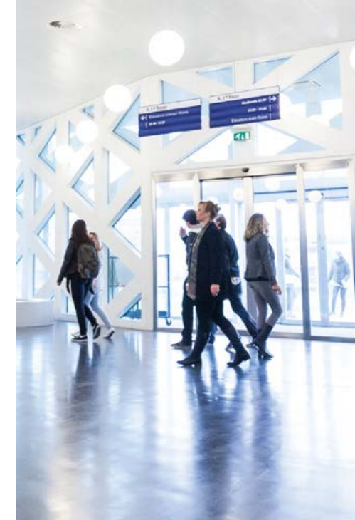
PAVIRO: система речевого и аварийного оповещения с качеством профессионального звука