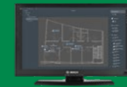
Програма перегляду карт